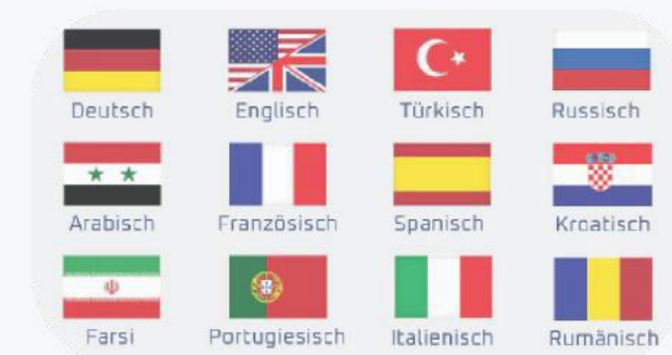
12 verschiedene Sprachen